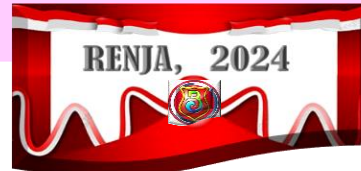
Tabel 3.4 Rumusan Rencana Program dan Kegiatan BAPPELITBANGDA Tahun 2024 Dan Prakiraan maju Tahun 2025